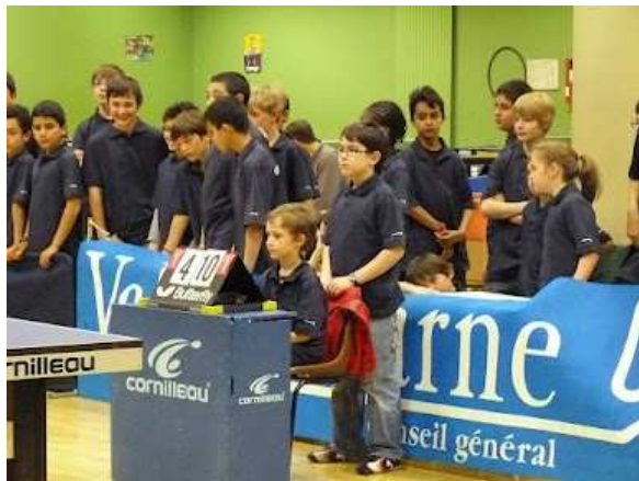
Les arbitres du jour

L'USF Tennis de Table a de multiples raisons de se réjouir de cette journée : au regard de la participation, ce fut un succès, avec 141 participants présents (petit bémol : il y avait 220 inscrits...) de 7 à 11 ans. Au niveau de l'organisation en amont et le jour J, tout s'est bien passé. Et comme rien n'est dû au hasard, remercions ici les entraîneurs, les bénévoles (qui ont tenu la buvette notamment), les parents des joueurs, les dirigeants et enfin tous les jeunes joueurs du club (qui ont officié comme arbitres). Leur aide fut plus que précieuse pour le bon déroulement du tournoi !