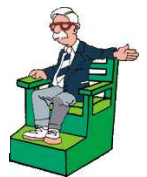
Le JA fou

Je me ferai un plaisir de vous répondre !